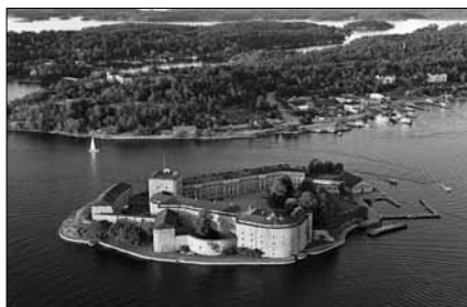
Vaxholm, archipel de Stockholm