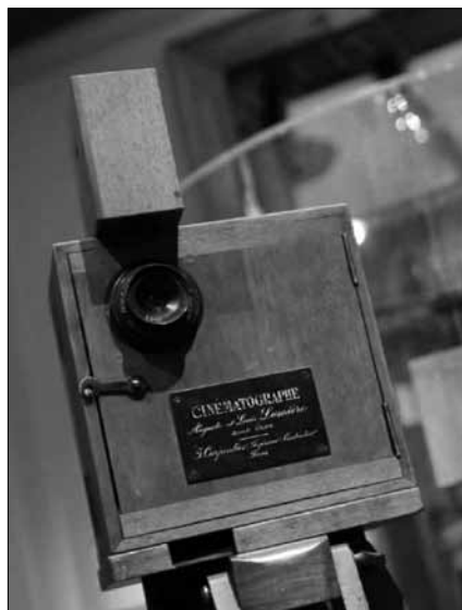
Musée Lumière, le cinématographe

Sur la route. Le trajet nous permettra de visiter Dijon et particulièrement son Musée des Beaux-Arts installé dans l'ancien palais des ducs de Bourgogne et dans l'aile orientale du palais des États.