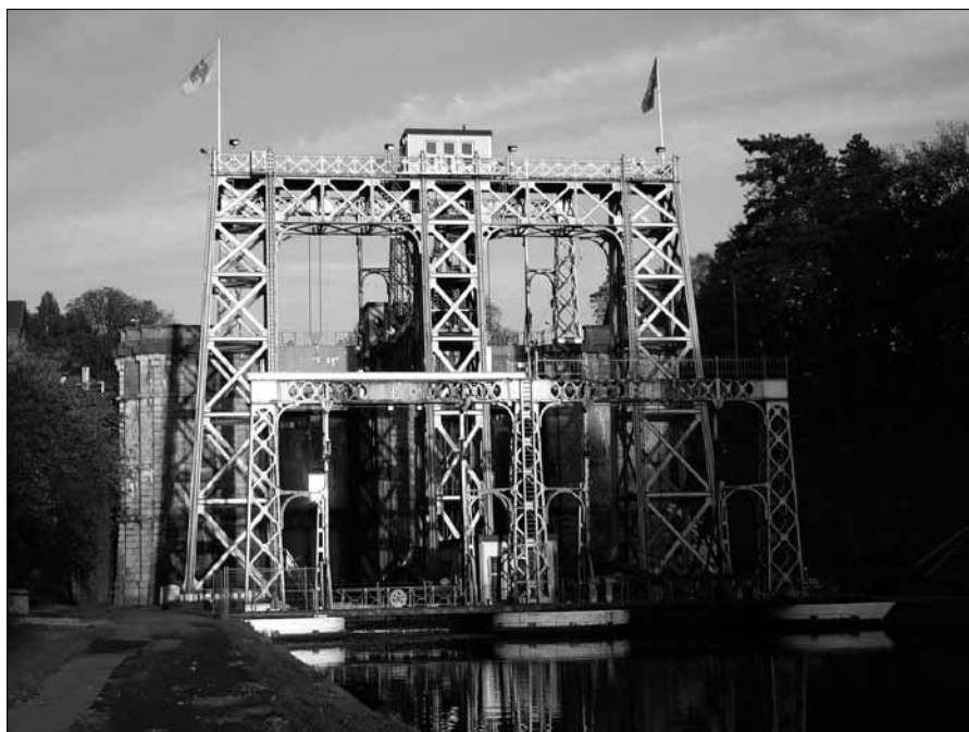
Houdeng-Aimeries - Ascenseur n° 2

Maisons du peuple. D'abord nichées dans de petites bâtisses au sein des citées ouvrières, les coopératives et sociétés d'ouvriers, décidées de rompre avec le système d'asservissement alors en vogue, intègrent de vastes maisons du peuple bien visibles dans les villes et communes. D'éloquents exemples affichent un style Art déco (architecture et décor intérieur) à Dour, ou Art nouveau, avec un sgraffite de Paul Cauchie à Pâturages.