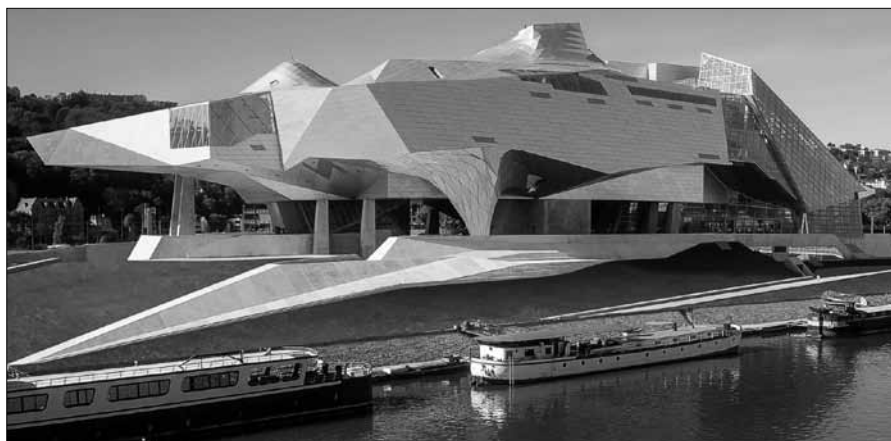
Le Musée des Confluences

Le Musée des Confluences inauguré en décembre 2014. Héritier du Musée d'Histoire naturelle, la nouvelle institution développe un projet dynamique, adossé aux questions, enjeux et défis contemporains ; son ambition est d'interroger le « temps long » seul à même de comprendre la complexité du monde et d'assurer sa mission fondamentale de diffusion des connaissances. Pour ce faire, le Département du Rhône a fait le choix d'une création architecturale, forte, originale, en relation et en écho du projet intellectuel et conceptuel du musée. Le bâtiment conçu par l'agence autrichienne CoopHimmelb(l) au s'articule entre Cristal et Nuage, entre le minéral et l'aérien.