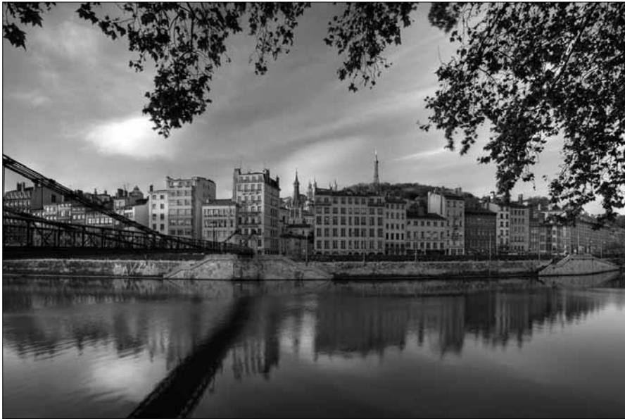
Le Vieux Lyon et la Saône

Aujourd'hui devenue la deuxième métropole française, Lyon montre l'exemple d'une cité historique qui sait concilier préservation patrimoniale et développements contemporains. Servie par une situation admirable au confluent de la Saône et du Rhône, la ville a structuré un tissu économique qui intègre l'évolution de l'industrie textile, les technologies de pointe, la recherche scientifique et le développement culturel.