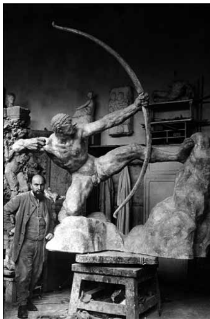
Antoine Bourdelle dans son atelier