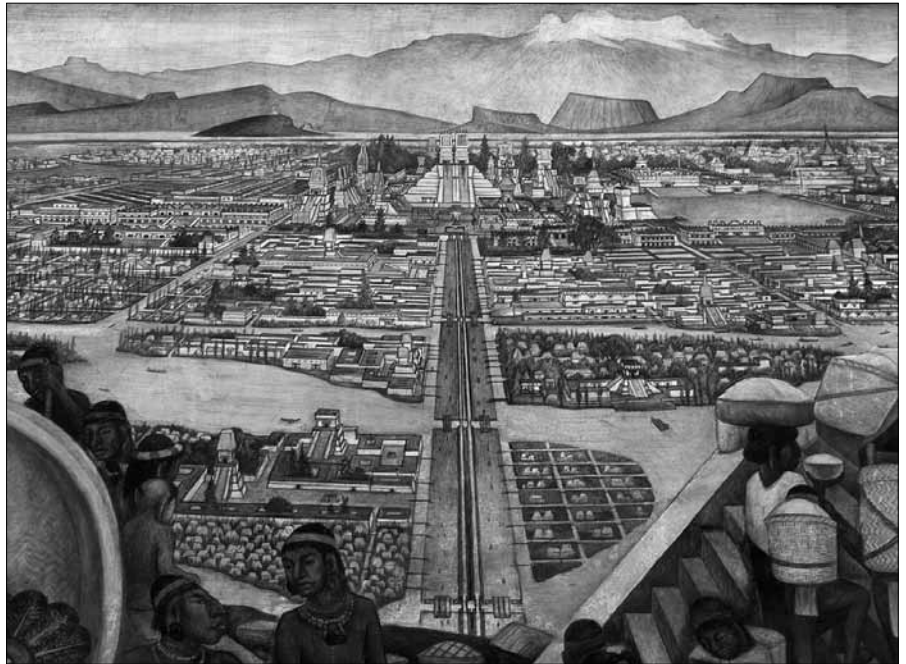
Tenochtitlan, peinture murale du Palais National par Diego Rivera

Le programme détaillé du voyage sera communiqué dans un prochain périodique. Le voyage sera accompagné par un spécialiste de la Société des Américanistes de Belgique.