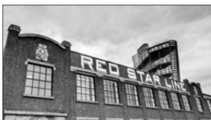
Red Star Line Museum

L'Eilandje. Plus ancienne zone portuaire d'Anvers, l' Eilandje est délaissé au XX e siècle avec la disparition de la Red Star Line, puis le déplacement du port vers l'arrière-pays. Il faut attendre les années 2000 pour que le quartier jouisse d'une nouvelle dynamique avec la construction de nouvelles infrastructures (logement, culture...) mais également la réaffectation d'anciens entrepôts et la préservation des anciens bassins, des grues de quai, ponts et écluses renvoyant au passé portuaire du quartier.