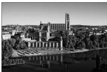
La cité épiscopale d'Albi