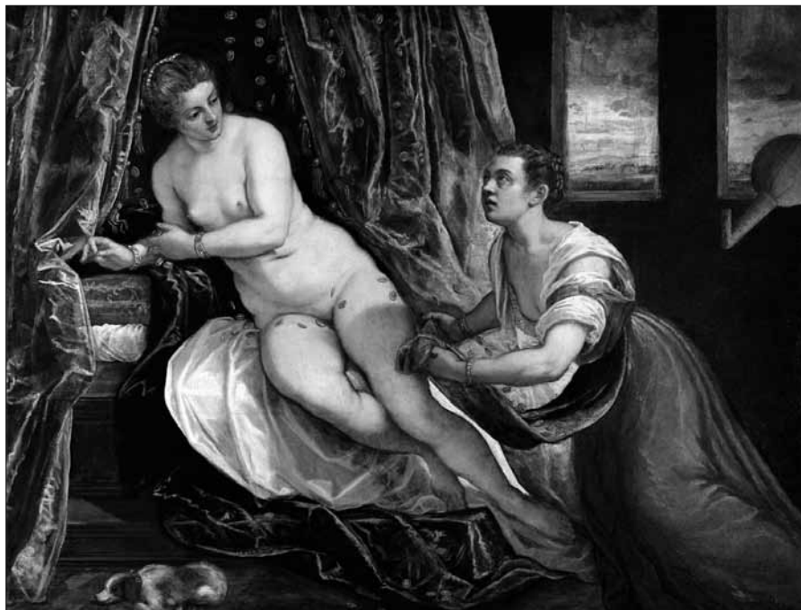
Le Tintoret, Danaë

concept de modernité, exposées dans plusieurs lieux emblématiques de la culture artistique de la Métropole. Rugoff a été conseiller auprès de la Biennale de Sydney en 2002, et de la Triennale de Turin en 2005, a siégé en 2013 au jury du Turner Prize, et en 2010 au comité de sélection du British Council au titre de la Biennale de Venise.