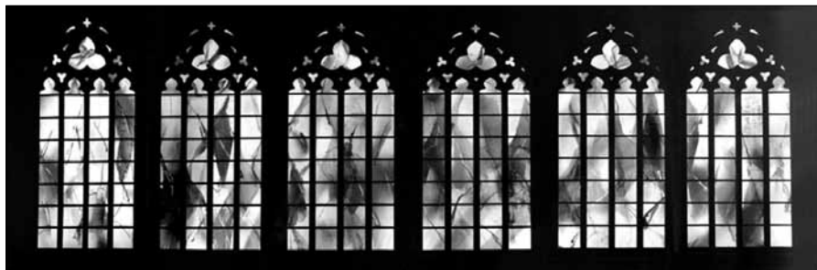
Vitrail de Kim en Joong