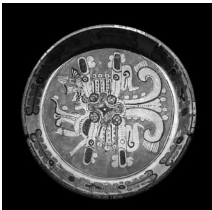
Céramique maya figurant Vénus , Musée de Mérida

Mérida. Capitale du Yucatan et centre culturel de grande importance, Mérida est fondée en 1542 par Francisco de Montejo sur le site d'une ancienne cité maya. Sur plusieurs monuments importants de la ville, dont la cathédrale, les pierres de réemploi portant des gravures maya sont encore bien visibles. Le centre historique de la ville, un des plus vastes d'Amérique centrale, présente encore de nombreuses constructions datant des XVIII e et XIX e siècles. De plus, un nouveau musée, achevé en 2012, est venu enrichir encore le patrimoine de la ville. Le Gran Museo del Mundo Maya abrite plus de 500 œuvres d'art présentées selon 4 grandes thématiques : l'intégration de la culture et de la nature, les ancêtres, les Mayas d'hier et les Mayas d'aujourd'hui. L'architecture résolument contemporaine du bâtiment fait cependant la part belle à la tradition, intégrant des éléments sculptés évoquant l'arbre « ceiba », figuration du cosmos selon la mythologie maya.