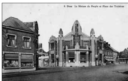
Dour, la Maison du peuple

Dès le début du XX e siècle, les maisons du peuples se multiplient, souvent inspirées par l'Art nouveau ou l'Art déco. Le Borinage compte plusieurs exemples remarquables, classés et restaurés. L'industrie marque fortement le paysage de la région : le canal du Centre et ses ascenseurs sont construits pour transporter par voie fluviale le charbon extrait dans le Borinage.