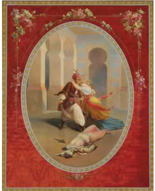
Fig. 5 Aladin ayant assassiné le frère du magicien