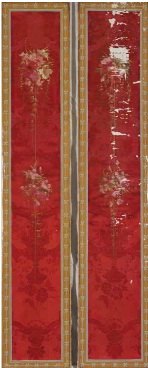
Fig. 6 Bandeaux décoratifs

place aux pieds de la dame le vase de porcelaine rempli de « pierreries » que la mère d'Aladin apporte comme présent au souverain.