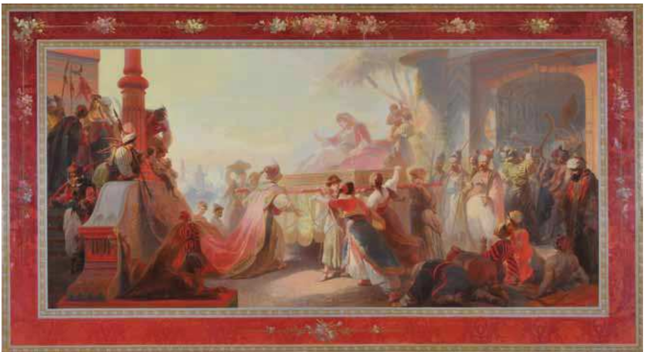
Fig. 4 Aladin accueillant Badroulboudour