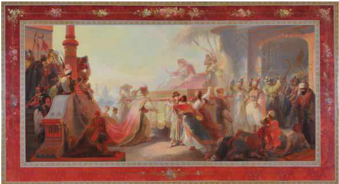
Aladin accueillant Badroulboudour

Mentionné brièvement dans les dictionnaires de peintres en tant que peintre-décorateur de grands ensembles allégoriques 1 , Joseph Carpay est aujourd'hui méconnu. La ville de Liège garde son souvenir par une rue portant son nom à Droixhe, par son imposant mausolée au cimetière de Robermont ou encore par quelques peintures conservées au Musée des Beaux-Arts. Pourtant, sa présence est plus importante dans de nombreux décors intérieurs encore conservés, autant dans des édifices publics religieux ou civils que dans des bâtiments privés.